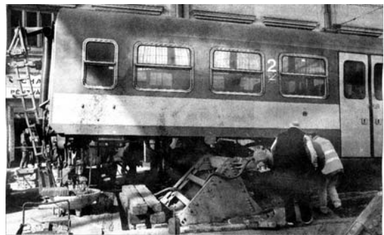
Kisiklott egy vagon a Nyugatiban Kisiklott egy vasúti személykocsi vasárnap reggel a Nyugati pályaudvaron. Nem sokkal kilenc óra után tolták be a kocsit a csarnokba a 10. vágányra, s az otthos kocsit – eddig ismeretlen okból – nekilőték a vágányzáró baknak, amely ezután letért a sínéről. Személyi sérülés nem történt, a baleset a vonatközlekedést nem befolyásolja.

Itt nagyon sokat emlékeztek! (Hit és élet Bács-Kiskun megyében Kalendárium 2008, beküldte: Holczer József .)