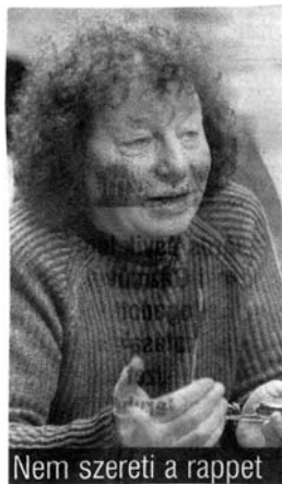
Nem szereti a rappet

Rap – rapet. (Helyi Téma, 2008. márc. 26.) (B. G.)